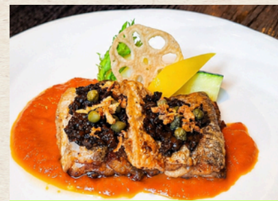
② 太刀魚のロースト ピペラードソース 1,680円