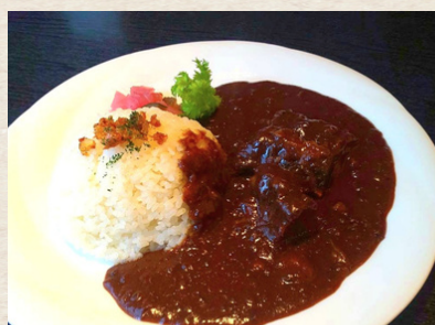
⑦ 和牛煮込みカレー 1,380円