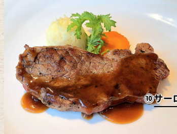
⑩ サーロイングリルステーキ 1,880円