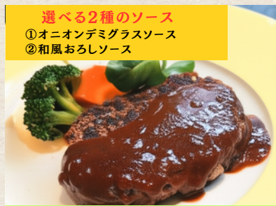
① 黒毛和牛グリルハンバーグ 1,480円