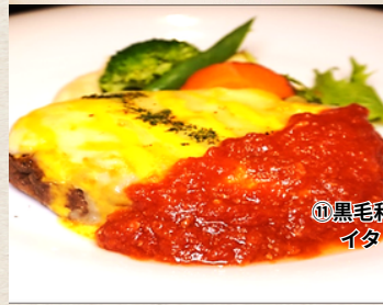
⑪ 黒毛和牛 イタリアンハンバーグ 1,580円