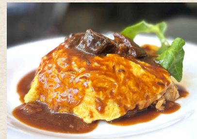
⑤ グリルチキンオムライス デミグラスソース 1,380円