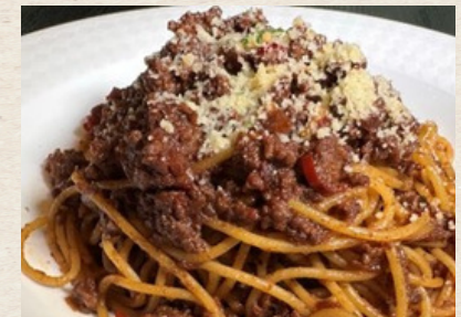
⑥ 和牛入りボロネーゼ 1,380円