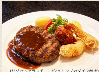
(リゾットアランチーニ/シュリンプカダイフ巻き) ④ 黒毛和牛グリルハンバーグ & フライ2種コンボ 1,780円