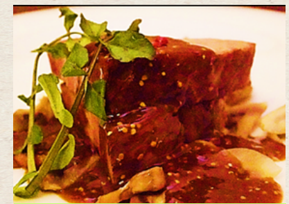
③ 肉塊!! 豚〜ズロック 1,580円