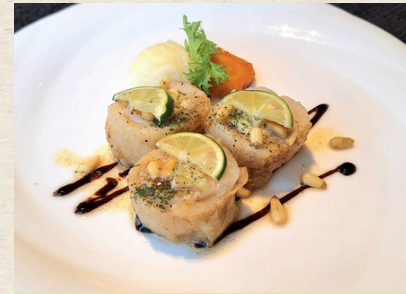
②舌平目のオープン焼き すだちと松の実のプランタニエール風 1,680円