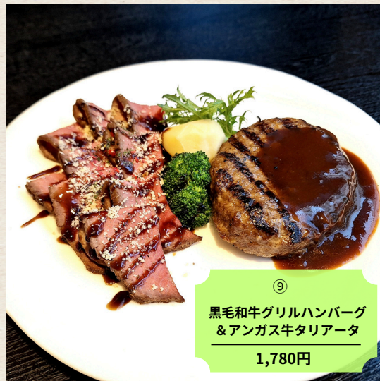
⑨ 黒毛和牛グリルハンバーグ & アンガス牛タリアータ 1,780円