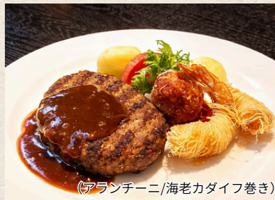
④黒毛和牛グリルハンバーグ & フライ2種コンボ (アランチーニ/海老カダイフ巻き) 1,780円