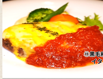
⑪黒毛和牛 イタリアンハンバーグ 1,580円