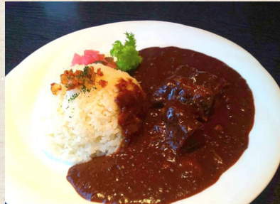
⑦和牛煮込みカレー 1,380円