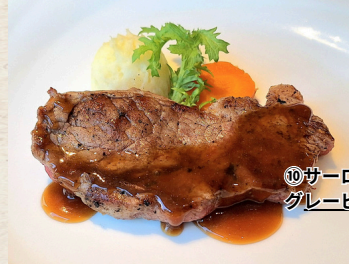
⑩サーロイングリルステーキ グレービーレフォールソース 1,880円