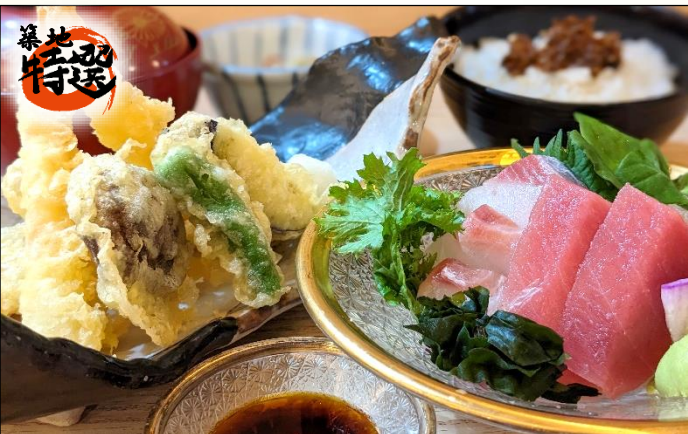
あかねくりや御膳 1,500円 刺身盛り合わせ・天ぷら盛り合わせ・じゃこご飯・小鉢