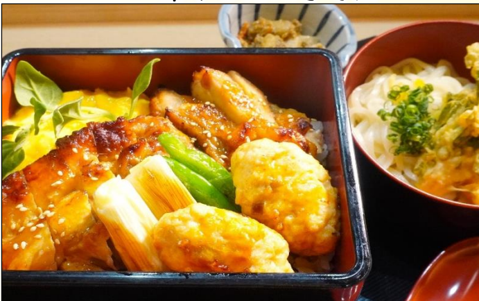
ナンコツつくねと焼き鳥重と 1,400円 冷やしかき揚げうどん