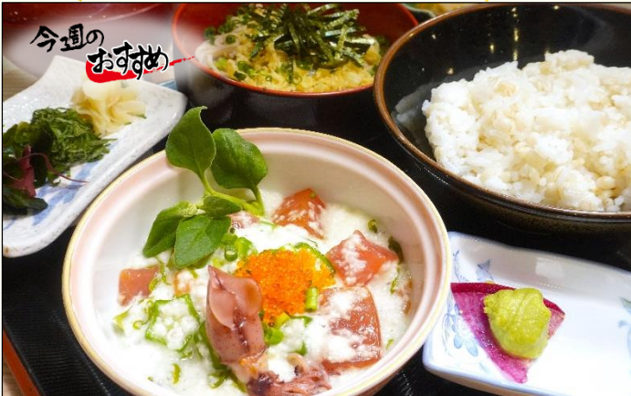
海鮮麦とろろ飯と 1,500円 冷やしたぬきそば