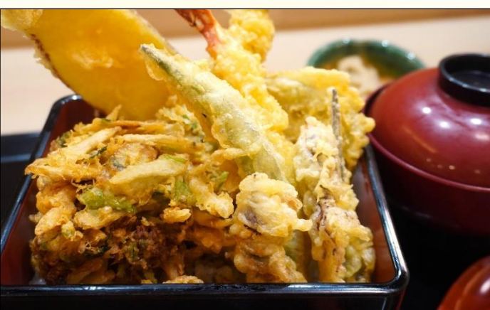
海鮮“冠”天重 1,400円 穴子、メゴチ、あさりとゴボウのかき揚げ、海老、オクラ 加賀れんこん、五郎島金時、ホタルイカ