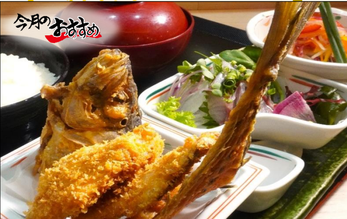
鱈三味膳 1,500円 鱈フライ・骨せんべい・刺身orたたき・鱈南蛮