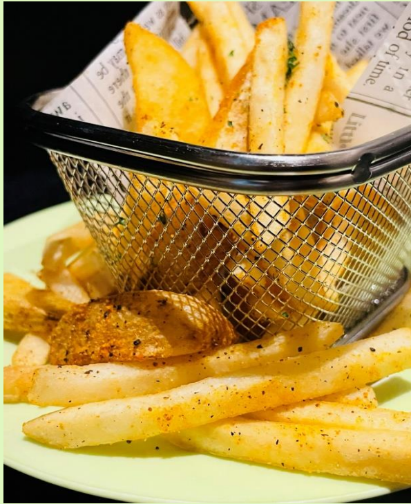
溢れフライドポテト チーズディップ添え French Fries -Dipping Cheese Sauce-