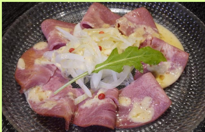
薄切りオニオンと牛舌スモークのサラダ Smork Beef Tongue Salad ¥720