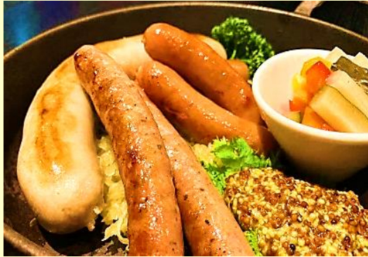
ソーセージバリエ Mix Sausage Platter ¥1,410