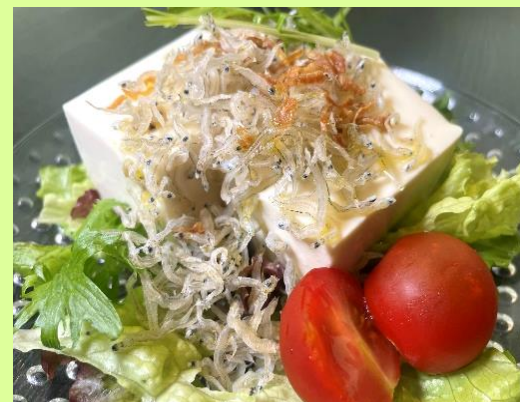
豆腐とじゃこの和風サラダ Soy Jelly & Dry White Bait Japanese Salad