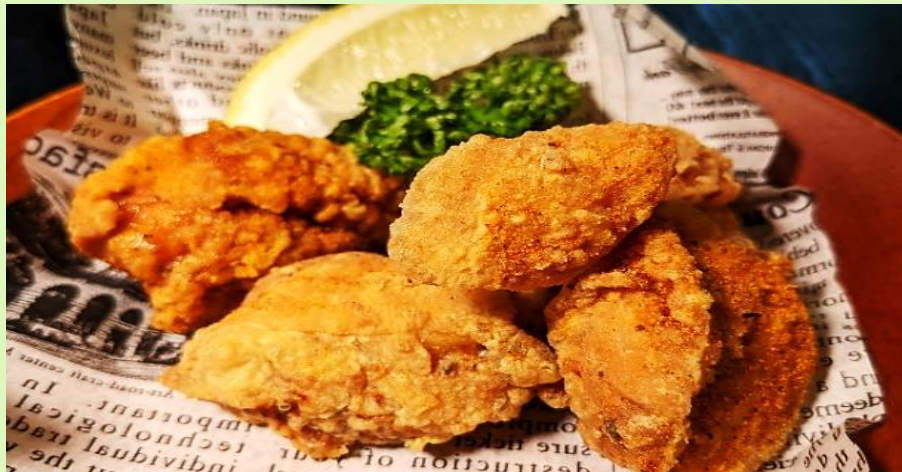
宮崎地鶏のからあげ Fried Chicken