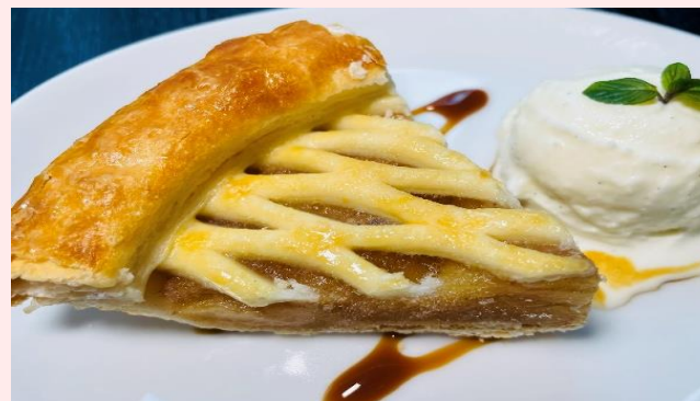
アップルパイ バニラアイス添え Apple Pie w/ Vanilla Ice Cream ¥860