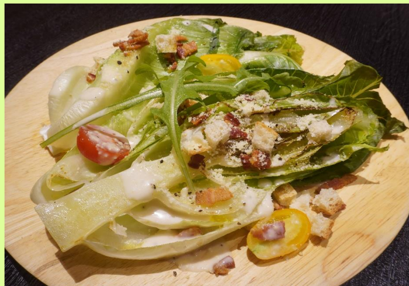
グリル ロメインレタスの シーザーサラダ Grilled Romaine Lettuce Caesar Salad