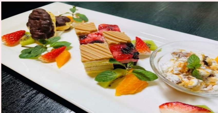
おすすめデザート 盛り合わせ Assortment of Recommended Desserts ¥1,320