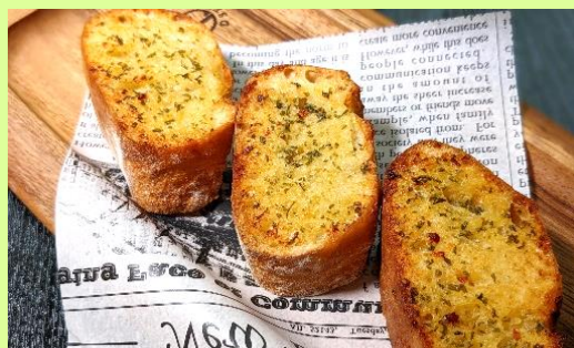
ガーリックバケット Garlic Flavor Bucket