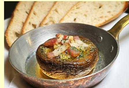
ジャンボマッシュルームの オープン焼き (バケット添え) Grilled Jumbo Mushroom. w/ Bucket ¥860

※サービスチャージ (おひとりさま220円込) 申し受けます。 Service charges apply (¥220/P)