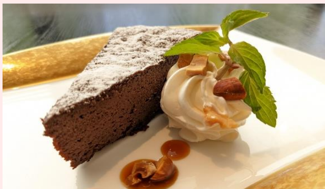
クラシックショコラケーキ ホイップクリーム添え Classic Chocolate Cake ¥720