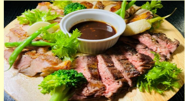
ミートバリエ (3kinds) (ビーフ&チキン&ポークの盛り合わせ) Grilled Meat Platter (Beef, Chicken & Pork) Regular ¥2,370 Half ¥1,210