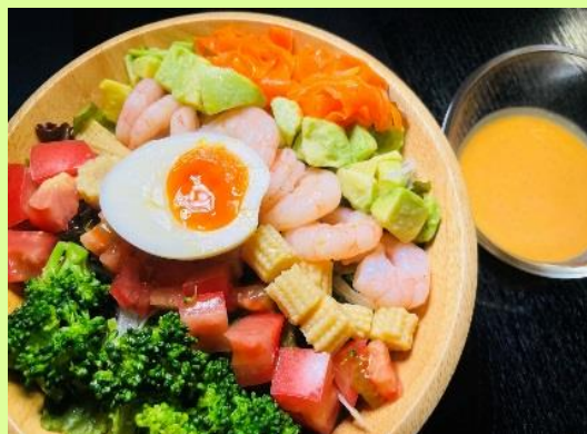
具たくさんコブサラダ Cobb Salad