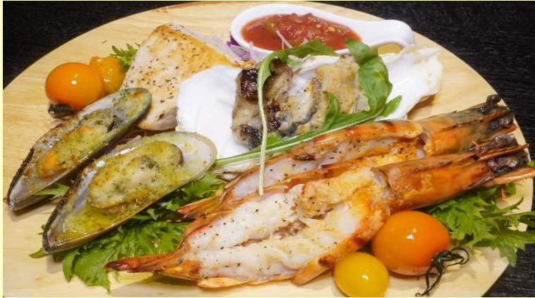
シーフードバリエ (有頭エビ・本日の魚・バーナ貝・カキ) Grilled Seafood Platter (Shrimp, Fish, Shell & Oyster) Regular ¥2,840 Half ¥1,490