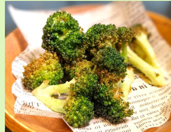
ブロッコリーのカリカリフライ Crispy Fried Broccoli