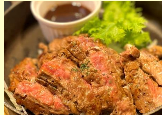
牛ラウンドカルビステーキ Beef Rib Loin Steak ¥1,050