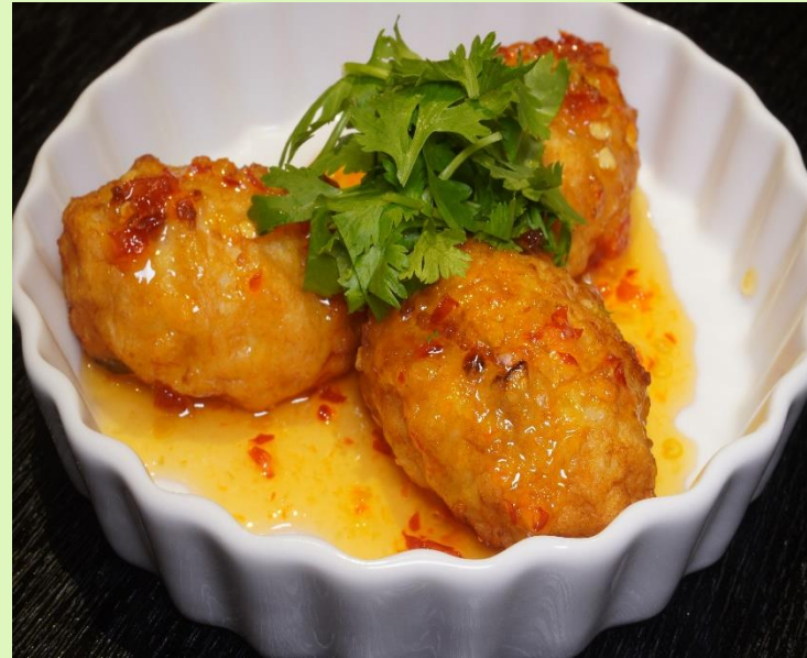
地鶏つくね揚げ スイートチリソース Fried Chicken Meat Ball -Sweet Chili Sauce-