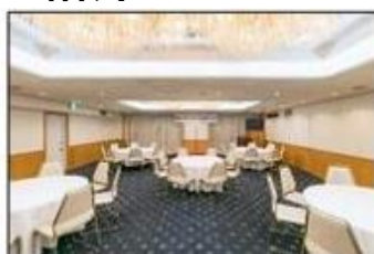
カトレア(円卓形式)