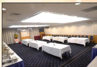
カトレア(立食形式)