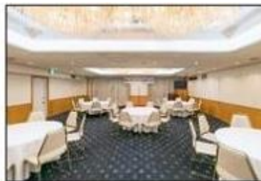
カトレア(円卓形式)